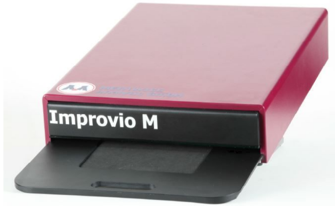
사진은 Improvio M의 서랍이 열린 모습

스트립을 올려놓는 패드를 완전히 볼 수 있을 때 까지 서랍을 앞으로 당깁니다. 패드는 서랍에 접촉되어 있으므로 잃어버릴 염려가 없습니다.